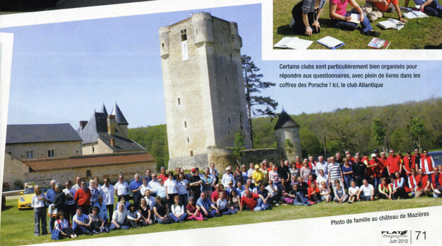
Photo de famille au château de Mazières