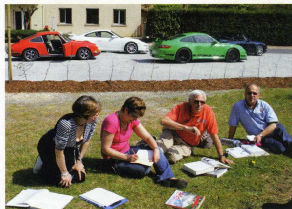
Certains clubs sont particulièrement bien organisés pour répondre aux questionnaires, avec plein de livres dans les coffres des Porsche ! Ici, le club Atlantique